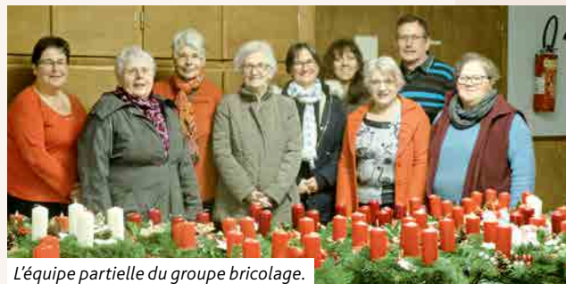
L'équipe partielle du groupe bricolage.

Moment fort à la paroisse protestante de Schweighouse-sur-Moder durant la dernière semaine de novembre, le groupe bricolage, constitué par des paroissiens et des conseillers presbytéraux, s'est rassemblé pour confectionner des couronnes d'Avent et quelques arrangements de Noël.