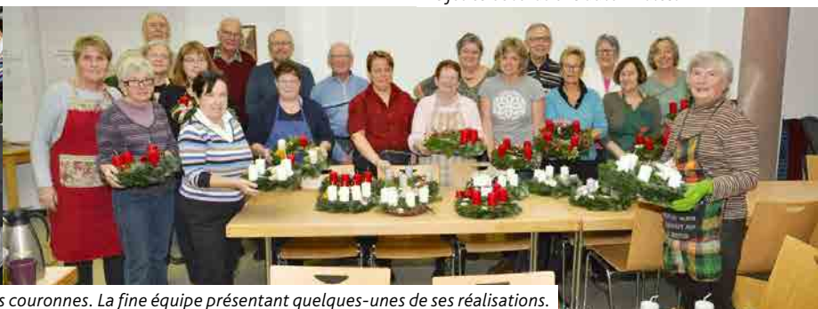
On a travaillé toute une journée pour réaliser de belles couronnes. La fine équipe présentant quelques-unes de ses réalisations.