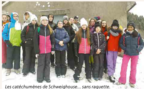
Les catéchumènes de Schweighouse... sans raquette.

Le seul bémol de cette aventure est qu'il n'y avait pas de neige !!!