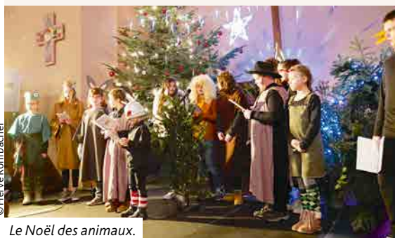
Le Noël des animaux.

À l'occasion de la veillée, les animatrices du club des petits prophètes ainsi que l'équipe technique qui les entoure pour s'occuper du son, de la lumière, se sont donné beaucoup de peine pour la réalisation de la saynète : le Noël des animaux !