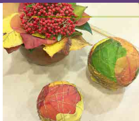
De jolies décorations automnales.