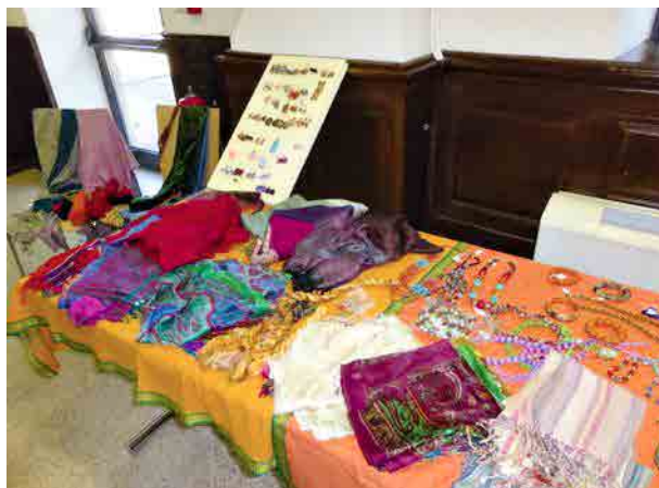
Le stand d'articles mis en vente par le couple Pfeiffer au profit de l'association « Les enfants de Pondichéry ».

Aujourd'hui l'orphelinat accueille environ 125 garçons âgés de 4 à 23 ans et 55 fillettes hébergées dans une maison à la campagne. Leur éducation scolaire est complétée par des activités traditionnelles qui font partie intégrante de la culture tamoule: musique, danse, arts martiaux, et plusieurs d'entre eux poursuivent actuellement des études supérieures.