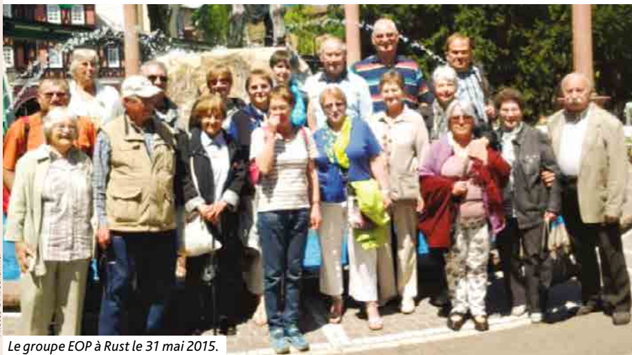
Le groupe EOP à Rust le 31 mai 2015.