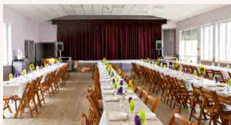
Le foyer rénové, prêt pour le repas du 20 septembre dernier.

D'ores et déjà, réservez votre dimanche du 20 mars pour le repas de l'Association du Foyer.