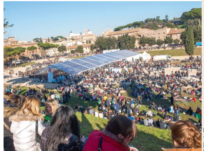
Taizé, pèlerinage de confiance.

Les jeunes (de 17 à 35 ans) amèneront leur matelas isolant et un sac de couchage. Ils pourront donc dormir par terre.