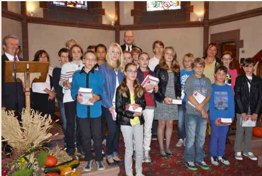
Les pré-confirmants recevant leur bible au cours du culte solennel.

Il est des jours, lorsqu'ils se terminent, on a l'impression d'avoir vécu des moments bénis!