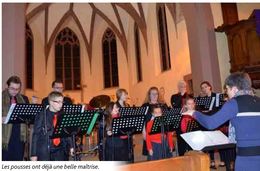
Les pousses ont déjà une belle maîtrise.

Il est possible de venir pour essayer durant quelques séances. Pour plus de renseignements, il suffit de s'adresser à Élisabeth Muths, 03 88 72 77 09.