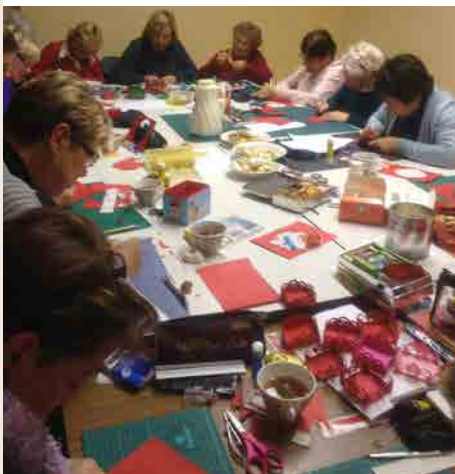
Création de paniers de papier pour la fête de Noël de nos aînés.