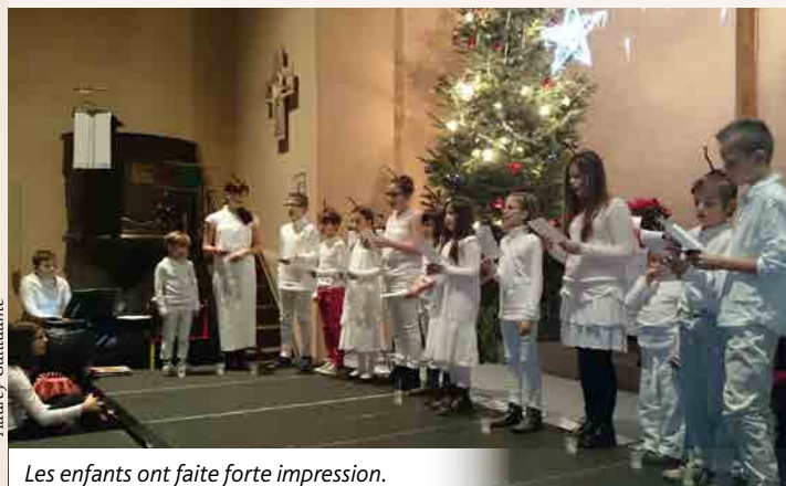
Les enfants ont faite forte impression.