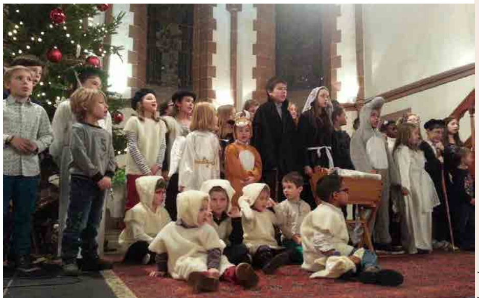
De l'avis de tous, ce fut une belle saynète.